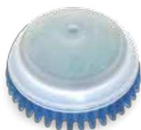
Bio Block Fresh

4) Po setření všech nečistot z pisoáru znovu aplikujte koncentrát na vnitřní stěny a nechte působit. Nestírejte!